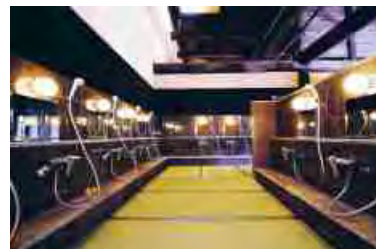
内湯洗場は畳敷の床面