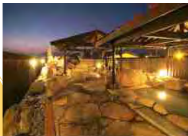
岩で囲まれた露天風呂

《入浴料》大人（中学生以上）500円、小人（4才～小学生）300円 回数券 11枚綴り 5,000円