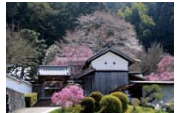
しだれ桜が見事な法持院