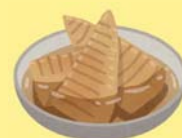
柔らかいたけのこで煮物はいかかでしょうか♪