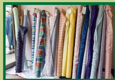
その場でカットして貰える生地！