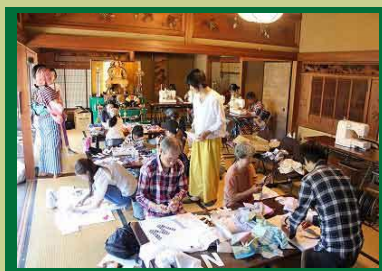
旧来住家住宅 ワークショップ

新型コロナウイルス感染症の影響により令和2・3年度と中止となった「播州織産地博覧会（播博ばんぱく）」が3年ぶりに開催されます♪