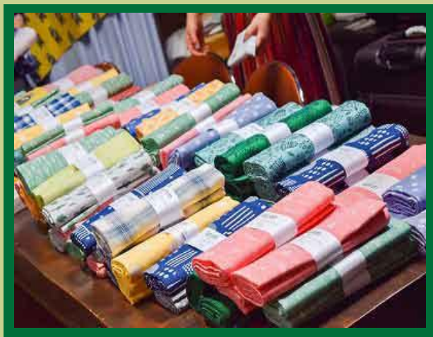
色鮮やかな播州織生地