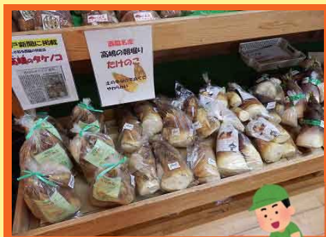
採れたての新鮮なたけのこ