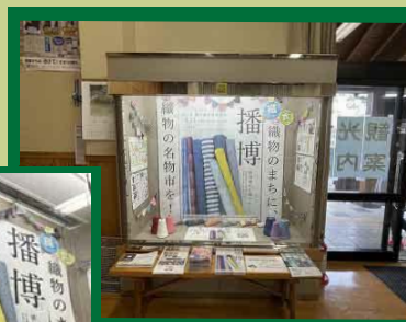
ショーケース展示