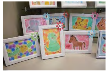
干支 子丑寅卯辰巳午