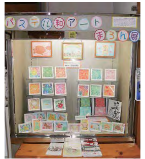
道の駅 ショーケース展示