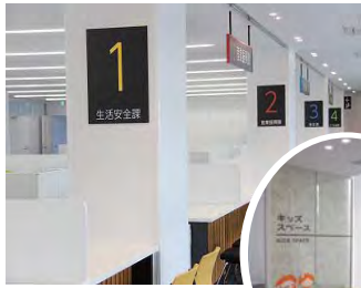
1階受付カウンター

サイン類やタペストリーに「播州織」を取り入れました。また、多可町産の木材を議場や会議室などに使用するなど、訪れた方に多可町の魅力を感じてもらえるよう工夫しました。