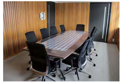
多可町産杉使用の会議室