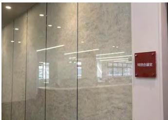
杉原紙を挟んだ壁面