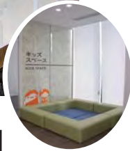
1階キッズスペース