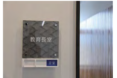
播州織使用の室名札