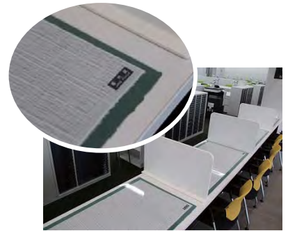
播州織の下敷きの受付カウンター