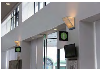
杉原紙使用したライト