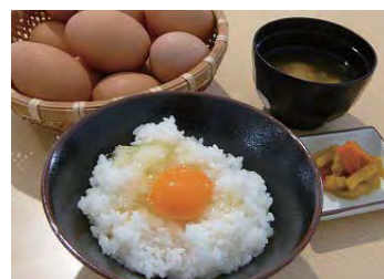
名物たまごかけごはん食べ放題！