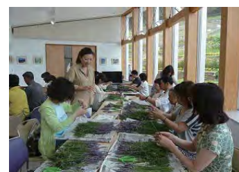
ラベンダーブーケ作り体験