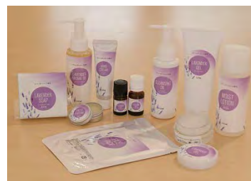
ラベンダーのオリジナル商品