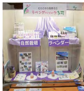
道の駅 ショーケース展示