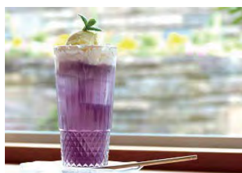
ラベンダークリームソーダ

兵庫県多可郡多可町加美区轟799-127 TEL 0795-36-1616・FAX 0795-36-1617 休園日：無休(シーズン以外は水曜日定休) 開園時間：9：00～17：00 入園料：高校生以上500円、小中学生200円 (シーズン以外は無料) ※開花時期はホームページよりご確認ください。 HP: http://www.lavender-park.jp