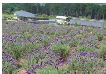
咲き誇るラベンダーの花