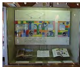
岡之山美術館 2010年9月ショーケース展示の様子

・7月の情報コーナーショーケース展示は 「岡之山美術館」です。道の駅にお立ち寄りの際は ぜひご覧ください。