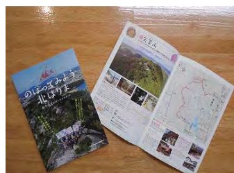
のぼってみよう北はりま