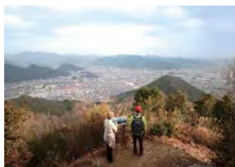
山頂からの市街展望♪