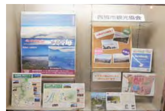
ショーケース展示