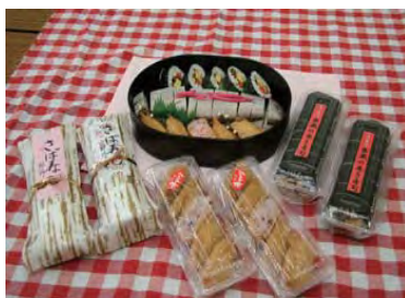
ふるさと工房夢蔵商品