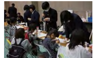
西脇工業高校の生徒による工作教室&ロボットショー