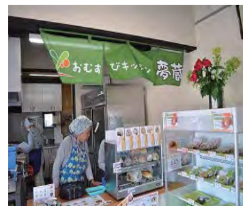
おむすびキッチン夢蔵店内