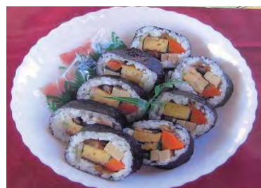
人気商品 巻き寿司

兵庫県多可郡多可町中区天田340-1 TEL・FAX 0795-32-4477 定休日/ 毎週水曜日 営業時間/ 9:30~17:30