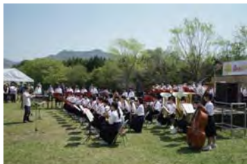
西脇南中学校吹奏楽部の合奏