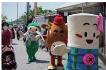
子どもたちに大人気ゆるキャラ、でんくる黒田牛兵衛・にっしー・たか坊・加東伝の助

雲一つない青々とした空の下、フリーマーケット 60 店舗、手作り雑貨・体験・フード 20 店舗、青空市、サテライト出店。たくさんのお店がふぁみり〜カーニバルに集まった。フリマでは人気商品はすぐに売り切れるので朝から大賑わい。