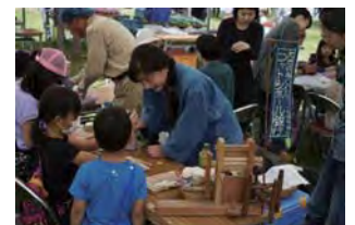
はりまコットンボール銀行やよい村の工作教室

天候にも恵まれすぎなくらい恵まれて、大勢の人の北はりまへ思いが溢れ出た暑くて熱い一日だった。