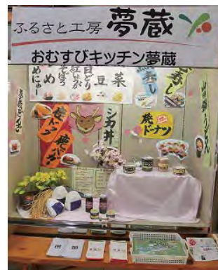
でんくうのショーケース