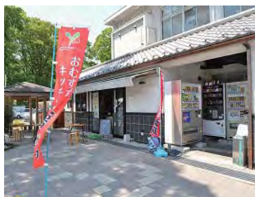
おむすびキッチン夢蔵外観