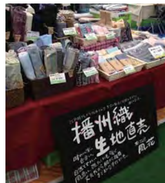
イベントでの生地や製品の販売。手にとると肌触りや美しさがわかる