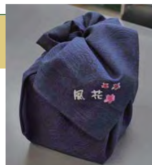
風呂敷にはかわいいロゴマーク入り