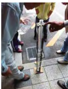
採水した水の1mの透視度を測定中