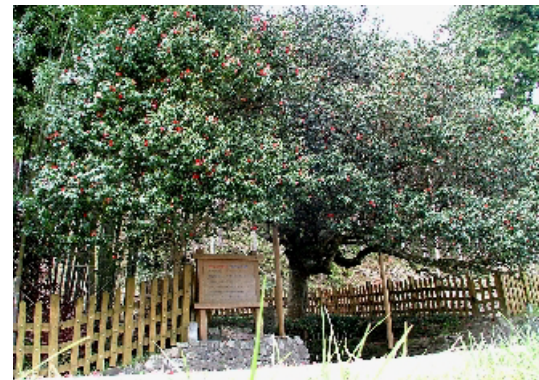
南側から見た化椿