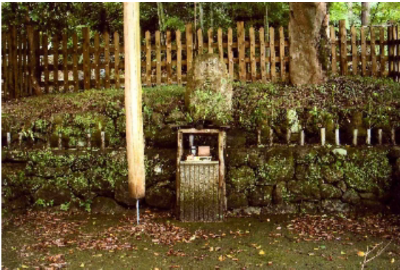
三界萬霊と五輪塔