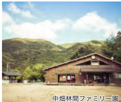
中畑林間ファミリー園