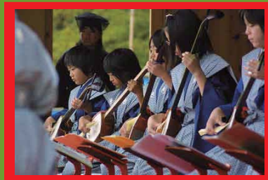
キッズ歌舞伎 三味線

日時：2020年2月9日(日) 13:30 開演 場所：多可町文化会館 ベルディーホール 一般・高校生 1,000円 中学生以下 500円 (当日券 200円増) ※全席自由席・未就学児は無料 ※詳細は多可町播州歌舞伎クラブ事務局まで