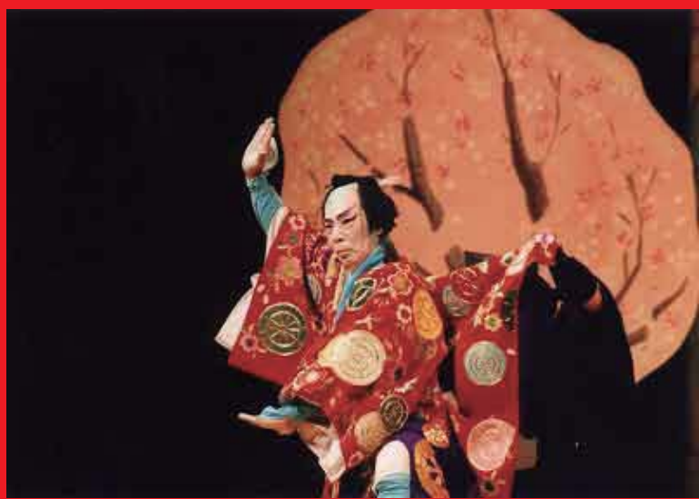
播州歌舞伎 一座千本桜

現在では一般社会人を中心としたメンバーがお互いに教え合い、年1回の定期公演の他、各地で公演を行っています。