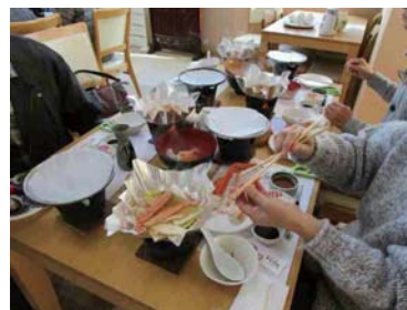
かに料理が色々。せっかくなので丁寧に食べて…