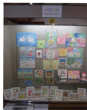
でんくうのショーケース展示

お子様も楽しめる教室ですので、親子連れ・お友達同士などで、ぜひ遊びに来て下さい(^^)