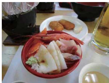
88人のバイキング、海鮮丼がやっと我が手に