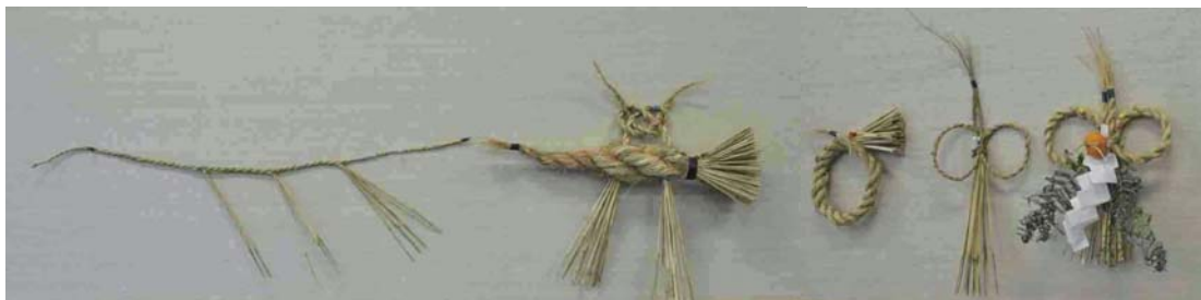
左から七五三、ごぼう、リース、めがね(小)、めがね(大)