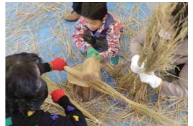
小さな子も藁たたきならできる

「数年かよってようやく自分でできるようになりました!」と言う参加者も。意外に女性も多く、子ども連れの方は家族で仲良く作業。完成したしめなわを手には、皆さん笑顔で帰られた。良い年をお迎え下さい。