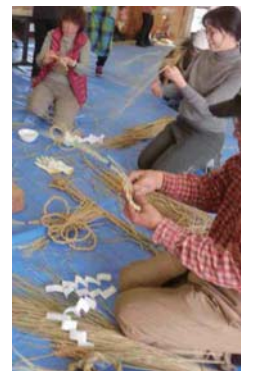
バランスを考え、輪を作り御幣(紙の飾り)を付ける