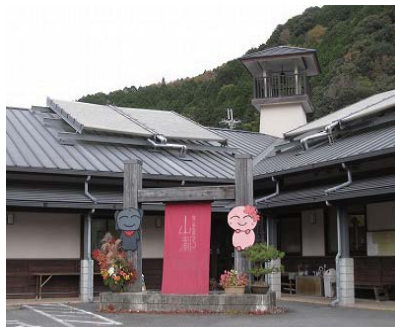
なごみの里山都入り口

「なごみの里山都」は、豊かな自然と文化を活用して大和地域全体の活性化を図るために、地域住民主導により整備されました。