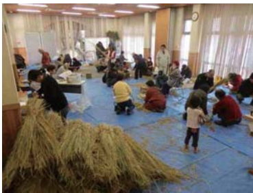
山田錦の藁が山のように

10(土)・18(日) 体験教室しめなわづくり 10日:26名 18日:34名参加