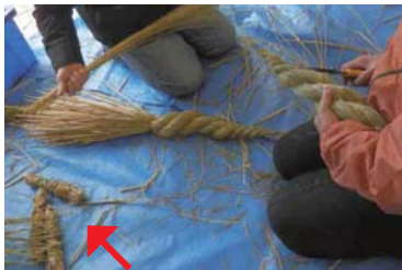
ごぼうは太い膨らみの中に左下の藁を入れるのが難しい

加する人も多く、指導スタッフも大変。その上ごんぼ(ごぼう)と呼ばれる上級者向けを作りたいたいと言う人が多い。めがねも左右の縄の太さやバランスが大切。輪がひとつだけのリースが一番作りやすい。それぞれの技術や飾る場所などでどれにするか決める。自分で頑張る人、先生に手伝ってもらう人などに、経験を重ねた指導スタッフはポイントをうまく伝え2時間ほどで完成。御幣とウラジロ、ユズリハ、小ミカンを水引で飾ると立派なしめなわ!