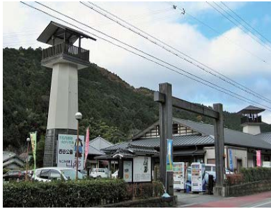
なごみの里山都外観

兵庫県多可郡多可町八千代区大和1520-1 TEL 0795-38-0753 ・ FAX 0795-38-0754 開館時間 喫茶/ 8:30~11:00 ・ レストラン/ 11:00~14:30(オーダーストップ) 山都の湯/ 11:00~17:00 ・ 各実習室/ 9:00~17:00(要予約) 休館日 毎週火曜日