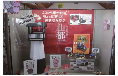
でんくうのショーケース展示