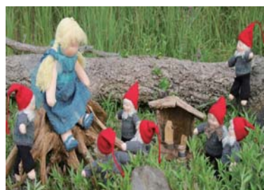
ウォルドルフ人形作品展