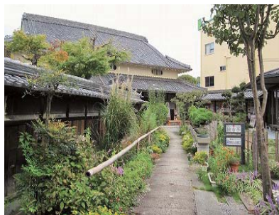
旧来住家住宅外観

兵庫県西脇市西脇394-1 TEL 0795-22-5549 URL: http://www.umekichi-tmo.jp/ 開館時間 10:00~18:00 (10月~3月は17:00閉館) 休館日 毎週月曜日(祝日の場合は翌日)・お盆・年末年始