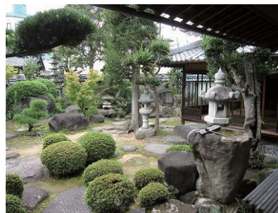
母屋縁側から眺める庭園