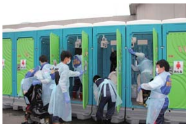
現地ボランティア活動展 (熊本地震 避難所仮設トイレ清掃作業)