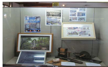
でんくうのショーケース展示