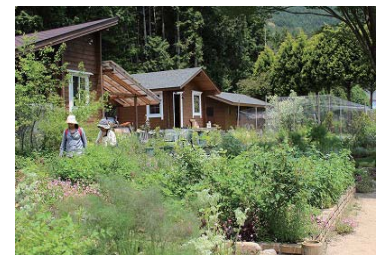
庭には季節ごとにハーブや花々が…。