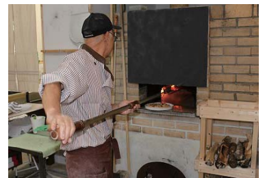
石窯でピザを焼きます

ランチとカフェの後は、ゆっくりと庭を散策して日頃の疲れを癒してはいかがでしょうか(^^)♪