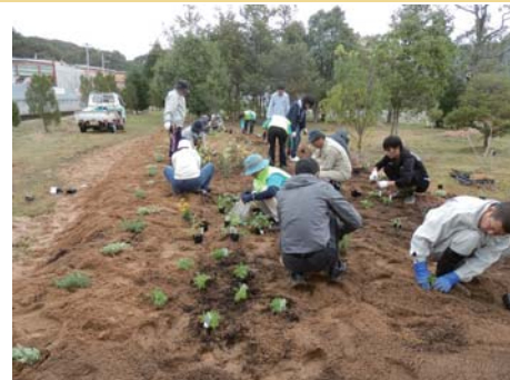
ハーブ植栽の様子 ご協力ありがとうございました！

・年末恒例「体験教室しめなわ作り」は12/10と12/18どちらも13時~16時、でんくう体験学習室で。申込は不要、参加費は300円です。