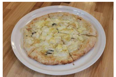
ピザはパリッとしてももちもち♪