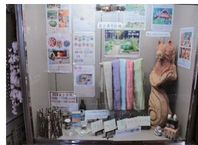
自然いっぱいのショーケース

「Suomi garden's スオミガーデンズ」は多可町中区の山裾にあります。