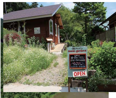
Suomi garden's スオミガーデンズ

多可郡多可町中区安楽田980-45 TEL 090-5130-0881 (ご予約・お問合せ) 営業時間 10:00~17:00 (Lo.16:30) ピザ: 11:00~15:00 (1日30枚限定) 営業日 金~月曜日 (年末年始・2月は休業)