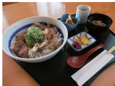
料理長イチオシ 黒田庄和牛丼

西脇市寺内517-1 TEL・FAX 0795-24-3400 営業時間 8:30～16:00 定休日 火曜日(祝日営業)