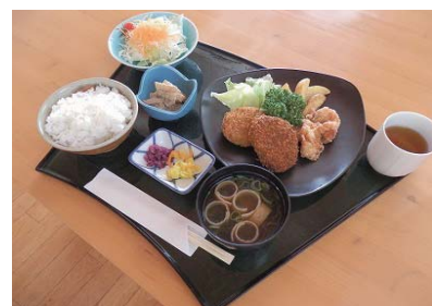
人気メニューを1皿にした ミックスフライ定食

「道の駅 北はりまエコミュージアム」に隣接する「レストランたにし」は7月よりリニューアルオープン！西脇ロイヤルホテルの運営となりました。