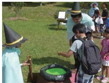
▲魔法使いゴッコ ▼ロボットショー