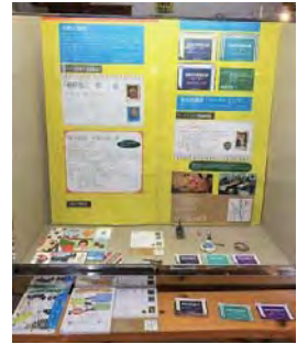
道の駅 ショーケース展示