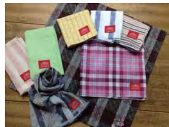
布工房 風花～kazahana～ 播州織ハンカチなどの製品

・8月の情報コーナーショーケース展示は 「布工房 風花 ～kazahana～」です。 道の駅にお立ち寄りの際はぜひご覧ください。