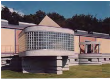
メディテーションルーム