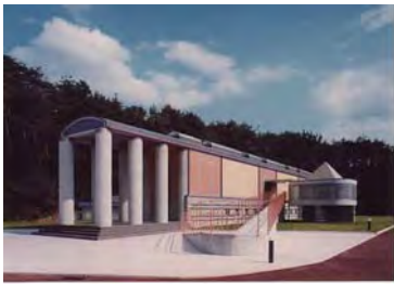
西脇市岡之山美術館外観