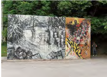
横尾忠則陶板壁画